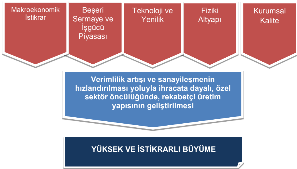
Şekil 5: 10. Kalkınma Planı Büyüme Stratejisi